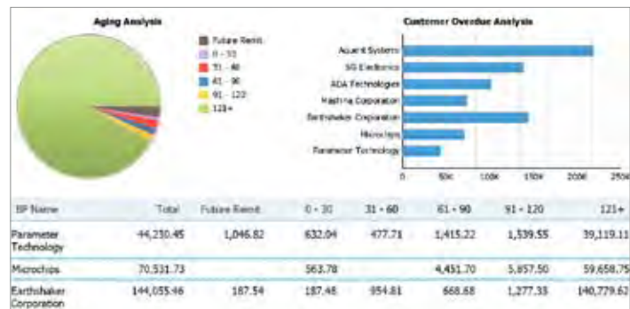
图 2: SAP Business One 的 SAP® Crystal Reports® 预构建报表摘录