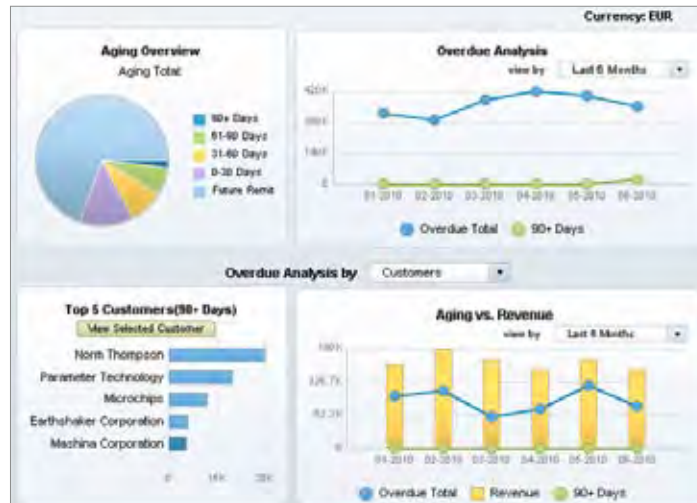
图 1: SAP® Business One 中的预构建财务过期仪表盘

此外，SAP Business One 不同于市场上其它大多数企业资源规划 (ERP) 应用，它提供可直接使用的预构建仪表盘。这样一来用户无需再开发仪表盘，从而降低了成本，加快了部署，且提高了用户满意度。