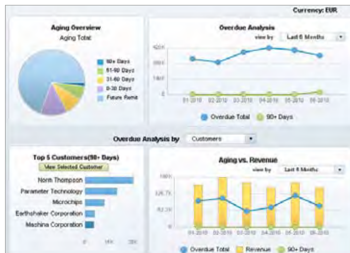
图 1: SAP® Business One 中的预构建财务过期仪表盘

此外，SAP Business One 不同于市场上其它大多数企业资源规划（ERP）应用，它提供可直接使用的预构建仪表盘。这样一来用户无需再开发仪表盘，从而降低了成本，加快了部署，且提高了用户满意度。